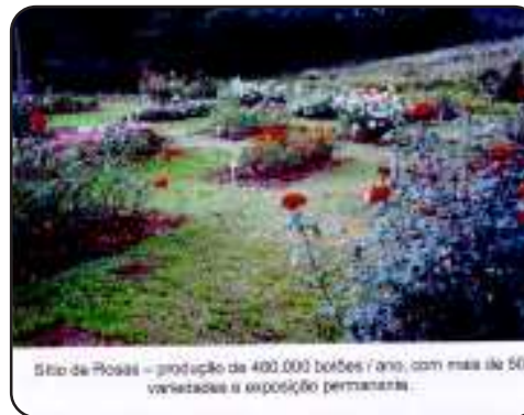
Sítio de Rosas – produção de 400.000 botões/ano, com mais de 50 variedades e exposição permanente...

O Município conta, desde 1995, com um sítio de rosas localizado na estrada Júlio de Castilhos, numa área de aproximadamente 16 hectares. A propriedade conta com duas estufas, cada uma de 1.500m 2 e implantação do paisagismo de um jardim de rosas com variedades exclusivas. A produção total da safra de 1998 foi de 232.000 botões e a projeção de produção para a safra de 99/2000 é de 460.000 botões. Atualmente a produção visa abastecer o mercado interno. Em 1997, os contatos internacionais se reforçam resultando num contrato junto à empresa alemã de melhoramento de rosas, Rosen Tantau, do qual são representantes exclusivos para todo o território nacional. O sítio de rosas trabalha em parceria com a Flora Brasiliae, e através do contrato com a empresa alemã, garantem uma fonte contínua de genética de última geração no cultivo de rosas de corte e