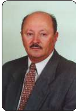
1.º Vice-Prefeito e atual Prefeito Darci Zanotto.

votos. O movimento iniciado em maio de 1985, referendado pelo plebiscito de 20/09/1987, e pela Assembléia em 15.12.1987, com a aprovação da Lei Estadual 8.482, durou dois anos e três meses.