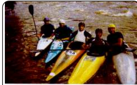
Canoagem Ecológica – campeonato estadual, realizado às margens do rio Turvo, na Capela São Roque, Vila Segredo

Sete e trilha de motos. O Camping tem boa infraestrutura para acampamento, com bar, energia elétrica, água, banheiros e amplo estacionamento, além de ser um lugar agradável, em meio à exuberância da natureza.