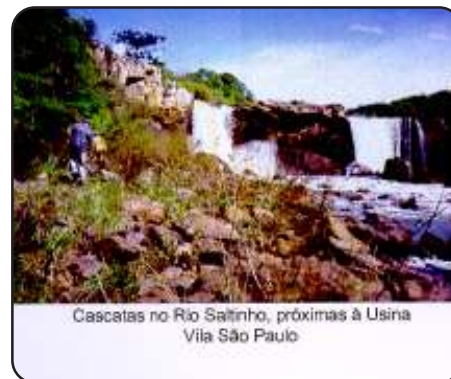
Cascatas no Rio Saltinho, próximas à Usina Vila São Paulo