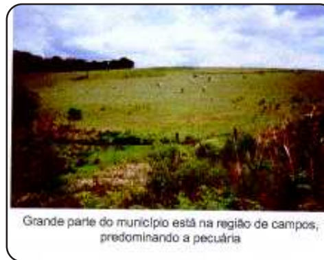
Grande parte do município está na região de campos, predominando a pecuária

Antônio Prado; a Leste com Campestre da Serra; a Oeste com Protásio Alves e André da Rocha.