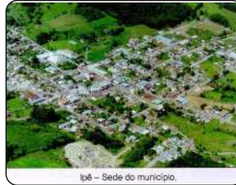
Ipê – Sede do município.

descendentes de escravos dos criadores de gado. Os casebres eram de chão batido, de tábuas rachadas e cobertos de tabuinhas. Por este motivo os colonos chamavam o lugar de “formigueiro” (1º nome de Ipê), uma parte da área desses casebres é, hoje, ocupada pelo