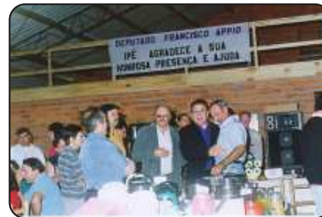
Dep. Appio na liberação de recursos ao Hospital São Pedro e para a saúde pública de Ipê.

O Município conta com 05 escolas que pertencem à Rede Estadual, na sede do Município, a Escola Estadual de Educação Básica Frei Casimiro, anteriormente denominada Escola Estadual Dom Frei Cândido Bamp. Na Vila Segredo, a Escola Estadual de 1º Grau São João Batista de La Salle e na Vila São Paulo, a escola de 1º Grau São Paulo. Conta ainda com as duas escolas de 1º Grau Incompleto São Valentim e Ângelo Fochezatto. Foi paralisada, a E. E. de 1º Grau Inc. Visconde de Mauá, na 2ª Companhia – Rio Teia. O Município de Ipê, ao se instalar, recebeu de Vacaria ( Município/mãe) 33 escolas em atividade e duas extintas. As extintas são: E. M. São Roque e E. M. Marcilio Dias. O Transporte Escolar e a diminuição da clientela, determinaram a extinção de algumas escolas que foram nucleadas, entre outras as Escolas Municipais: Santa Olímpia, Cel Avelino Paim, Caldas Júnior, Libório Rodrigues, Santo Antônio da Vendinha do Mel, Santo Antônio de Segredo, Joaquim Nabuco,